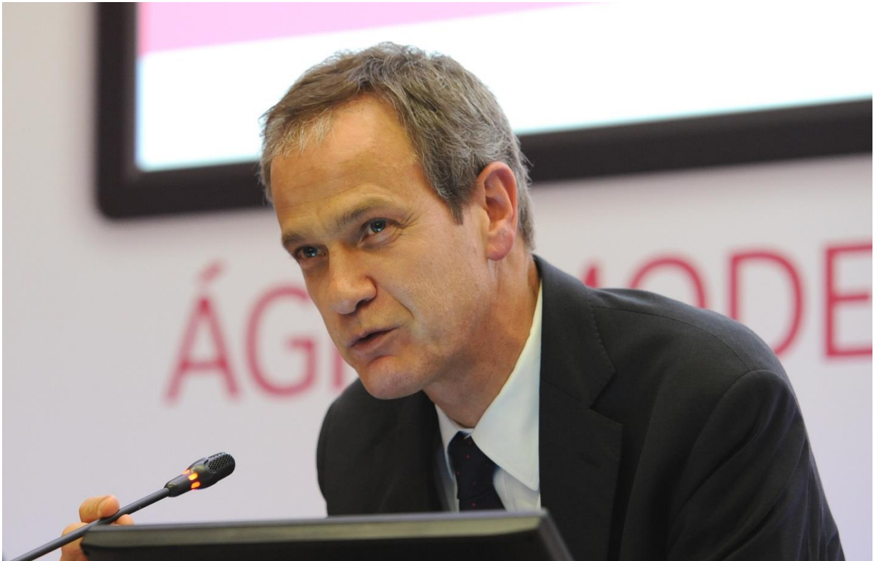
Miguel Maya CEO Banco Millennium bcp

O que levou o Millennium bcp a ter vontade de integrar o IFRRU 2020? Qual a importância deste instrumento financeiro na estratégia global do Banco?